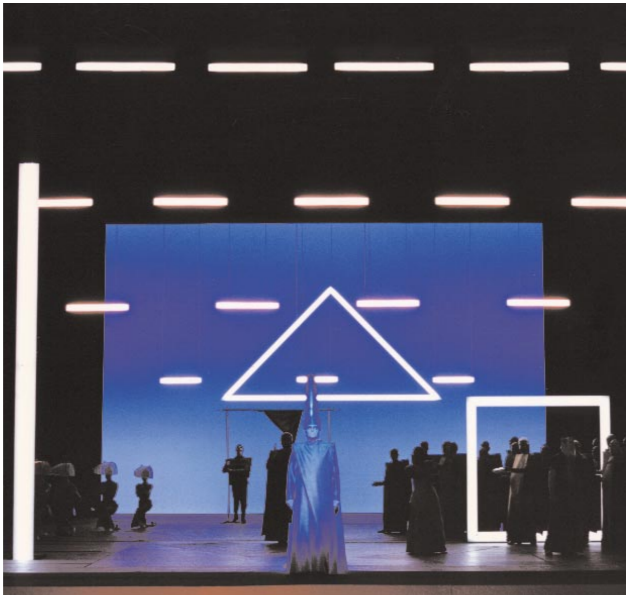
IL FLAUTO MAGICO - Opéra Bastille, Parigi, 1991.