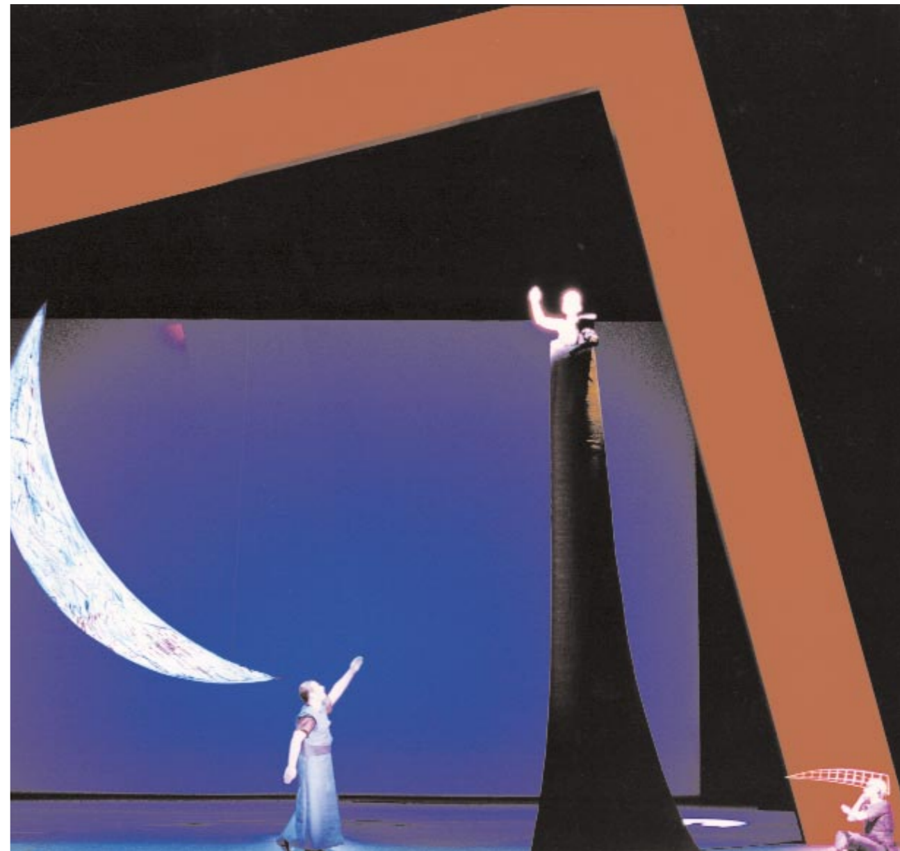
IL FLAUTO MAGICO - Opéra Bastille, Parigi, 1991.