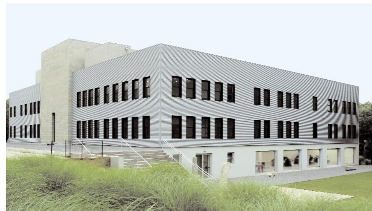
Il Watermill Center, sito nelle vicinanze di Southampton, Long Island, è stato fondato nel 1992 dal Robert Wilson